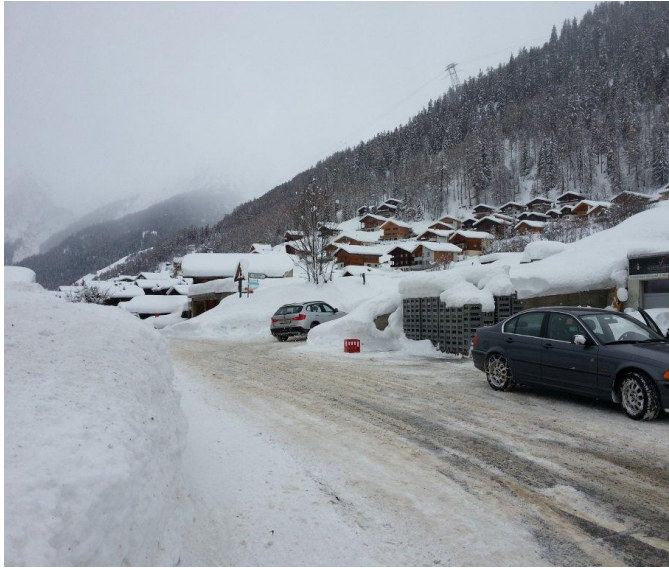
Ende Dorf beim Getränkedepot links und wieder rechts