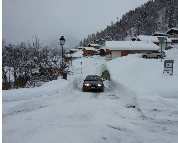
Oben nach dem zweiten Bogen links leicht hinab (Ägerta / Ufem Dorf)